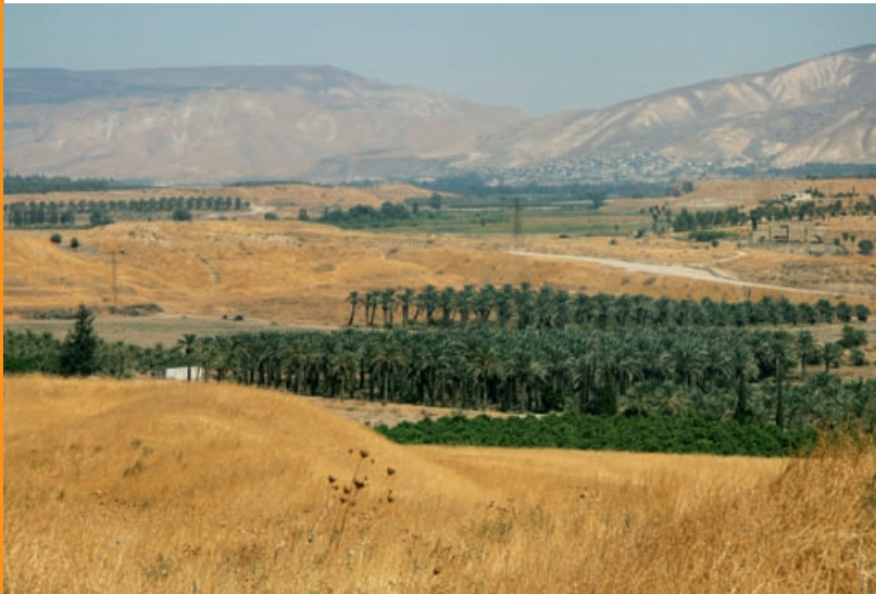
Dolina Jordanu w okolicy Bet Sze'an

Wyżyny ograniczone są od wschodu stromym progiem, opadającym do Rowu Jordanu i Morza Martwego. Ta szeroka dolina stanowi przedłużenie wielkiego rowu tektonicznego, w którym leży również Morze Czerwone, a który dalej na południe ciągnie się przez Etiopię i całą Afrykę Wschodnią jako Wielki Rów Wschodnioafrykański. Przez północną część tego obniżenia płynie najdłuższa w Izraelu rzeka Jordan (251 km), której źródła znajdują się na terenie Libanu w górach Antylibanu. Jordan spływa najpierw ku wodom Jeziora Galilejskiego, które jest największym słodководnym akwenem w Izraelu, a następnie przez coraz dziksze i bardziej suche tereny aż do Morza Martwego. To bezodpływowe, ekstremalnie zasolone jezioro leży w najgłębszej depresji na świecie (418 m p.p.m.). Przedłużeniem Rowu na południe jest dolina Arava, którą zajmuje sucha